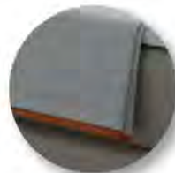
Typ 100 Plaid Klassik Kanten mit Einfassband paspeliert