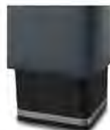
H 05-10 H 05-15 Holzfuß wengefarbig