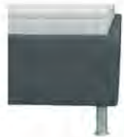
Bettkasten glatt classic Höhe ca. 35cm