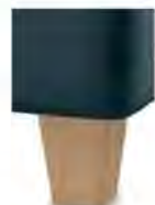
H 17-10 H 17-15 Holzfuß Buche natur lackiert