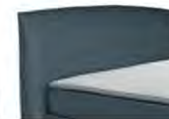
0815 Höhe 118 cm