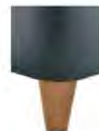
H 25-10 H 25-15 Holzfuß Eiche natur geölt