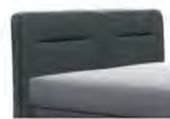
0728 Höhe 119 cm