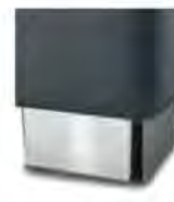
M 09-10 M 09-15 Metallfuß verchromt