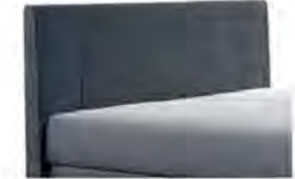
0320 Höhe 115 cm