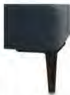
A 11/M01-10 A 11/M01-15 Alufuß schwarz matt