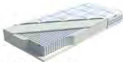
MA 425: Periletto 1000