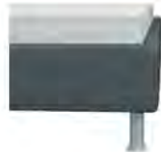
Bettkasten glatt modern Höhe ca. 29cm