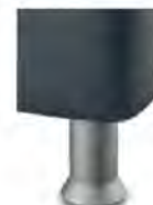
K 01-10 K 01-15 Kunststofffuß alufarbig