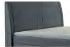
0050 Höhe 117 cm