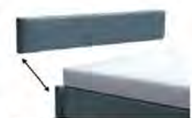
Kopfteilblende 3029 - Höhe 29 cm 3035 - Höhe 35 cm