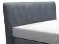
0413 Höhe 127 cm