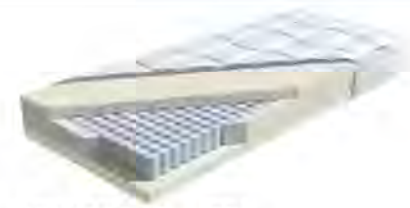
MA 355: Periletto TFK