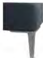
A 11/M12-10 A 11/M12-15 Alufuß gebürstet