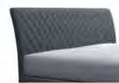
0752 Höhe 117 cm