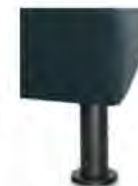
M 24-10 M24-15 Metallfuß schwarz