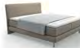
Typ 100 Plaid Klassik komplett geöffnet deckt die Liegefläche nicht ab.

Bitte bei Bestellung (vor allem Einzel- oder Nachbestellung) immer die Bettmaße angeben. Die angegebenen Maße sind ca. Maße. Geringfügige Maßabweichungen zur Liegefläche plus Volanthöhe sind produktionsbedingt