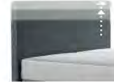
0300 Multimaß Höhe 70 - 125 cm in 5cm-Schritten kürzbar