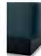
S 01-10 S 09-15 Schwebeoptik mit Sockelblende

Bitte alle erforderlichen Vorgaben zu einer Bestellung beachten.